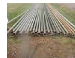
井戸メンテナンス工事