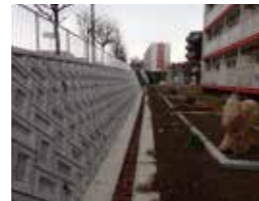
谷地盛土上の擁壁改修