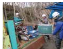
各種物理探査、検層