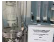
室内試験(土質・岩石)

この部門は社会を支えるインフラストラクチャーの基盤を調査しています。道路や橋、ダム、建物などを造る前に地質調査をして基礎地盤の種類や性質、特性などを正確に判断することが主な業務です。実際には直接目に見えない部分を探るため、調査内容を裏付けるために地形図・空中写真等の判読に基づいて、現地の地形判読をしてから業務に臨みます。ボーリング調査の現場では採取された土・岩盤試料(コア)を原位置での物性値と併せてリアルタイムで観察・報告をし、調査対象の特性や地盤状況に応じた十分な調査をします。時にはボーリング調査中に問題点や不足点が発覚することがあるため、迅速に他アプローチ(原位置試験・土質試験)を提案・実施をして設計・施工に問題が生じないように調査を進めます。地質調査は、安心・安全なインフラ整備につながる重要な業務です。どんな調査でも、人々の生活の下支えに直結するため、責任感を持って日々取り組んでいます。