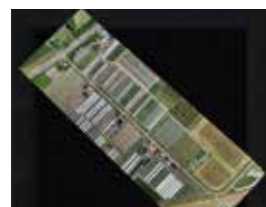
UAV レーザ測量・解析