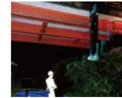
夜間橋梁点検 (鉄道上)