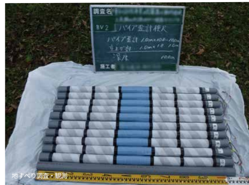
地すべり調査・観測