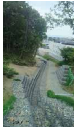
都市急河川の護岸整備