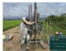
液状化、軟弱地盤解析