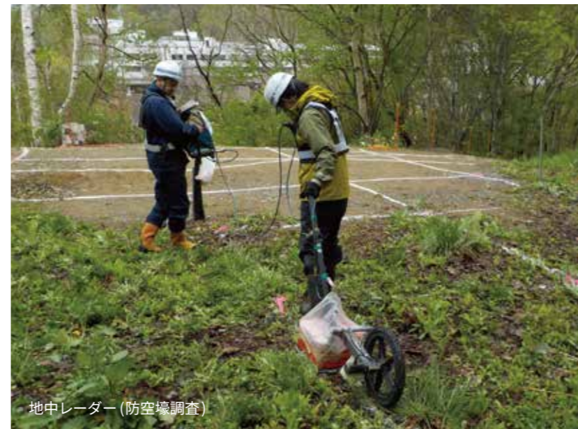
地中レーダー (防空壕調査)

UAVレーザ測量・解析 / UAV 写真測量・解析 / UAV 写真・動画撮影 / 用地測量 / 地形・路線測量 / 山腹・溪間測量 用地測量