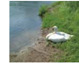
河川・湖沼環境調査