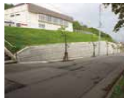
高盛土擁壁の改築