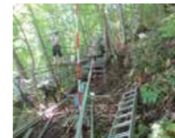
砂防、急傾斜地対策調査

最近、各地で豪雨による地盤災害が多くなっています。この部門は地すべりや斜面崩壊、土砂崩れについて調査を行ってリスクを評価し、対策を検討します。現場は急斜面であることが多く、資機材搬入はモノレールを設置して行うことが多いです。調査は高品質ボーリングにより破碎の程度や変質、風化の程度、粘土化部を詳細に観察することを軸とし、これら特徴を見逃さないよう調査をします。地すべり調査は地下水の動きが重要であるため、ボーリング孔を利用して地下水流動を把握する試験を実施します。また、地中内部の変動を観測できる計測器や地下水位の変化を観測するセンサーを設置して定期的に観測することも重要です。これにより月～年単位で変動値を観測し、累積性の有無を確認しています。弊社では調査・設置・観測・解析作業を一貫して実施し、国土保安や安全・安心な社会の実現に寄与します。