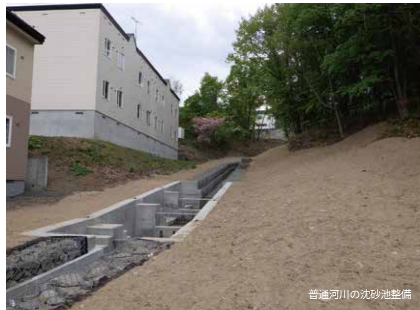
普通河川の沈砂池整備